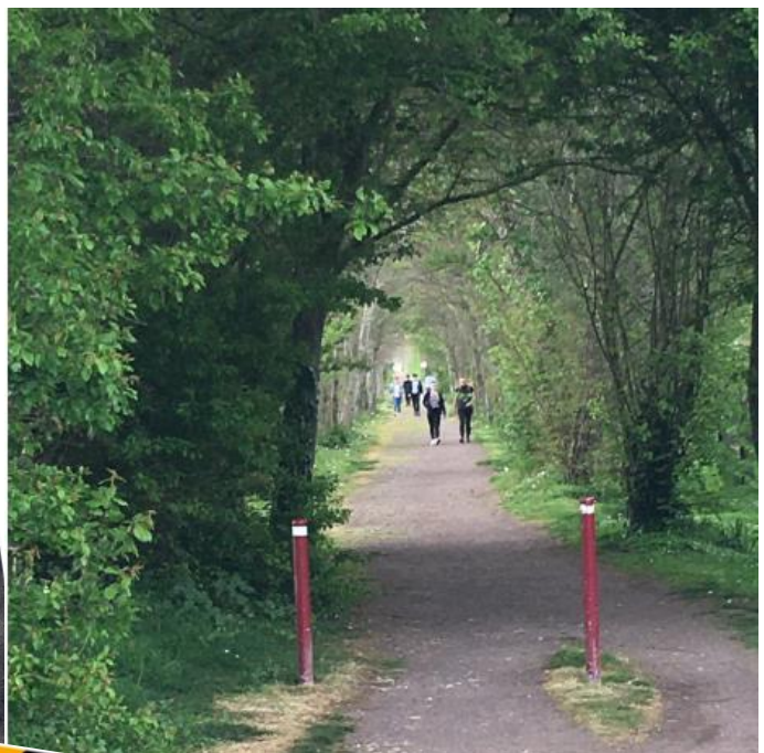
Le chemin de la 59 ème le jeudi 16 Avril 2020 à 18h30