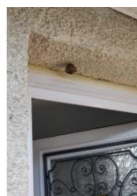
nid primaire trouvé rue des loisirs à Epron le 14 avril 2020)

Ces nids permettent à la reine de pondre ses premiers œufs puis elle ira avec un petit groupe d'ouvrières construire un nid secondaire perché à une dizaine de mètres dans un arbre qui accueillera 2000 frelons. La destruction de ses nids secondaires est donc beaucoup plus difficile à atteindre et même à repérer.