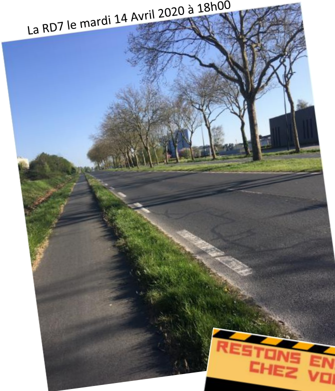
La RD7 le mardi 14 Avril 2020 à 18h00