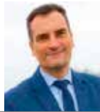
Franck GUÉGUÉNIAT Maire d'Epron