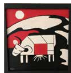
Petite vache (collage acrylique sur bois)