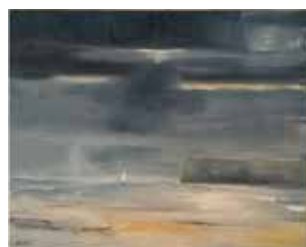
Marine (Huile sur toile)