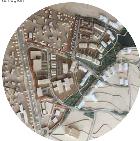
Maquette du projet de la ZAC de l'Orée du Golf

Et puis, l'attrait de la commune perdure et de nouvelles structures, dont certaines identifiées comme « Start-up » souhaitent venir s'y installer, peut-être attirées par le grand projet « Epopéa » développé sous l'égide de Caen la Mer. Nous pouvons en prendre pour exemple la société Metaoptics, créée depuis moins d'un an, spécialisée dans la réalisation et la pose de verres correcteurs adaptés à des montures spécifiques et particulièrement celles portées par des sportifs. C'est une innovation dans le monde de l'optique. Elle vient de se voir attribuer, il y a quelques jours, le « Silmo d'Or » lors du salon mondial de Paris.