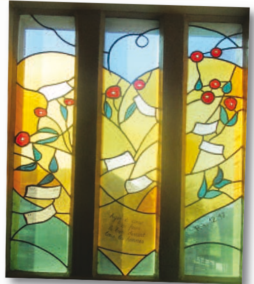
Epron, village partiellement reconstruit par la solidarité relayée par la radio. Epron, Village de la Radio. « Ayez à cœur de faire le bien » Rm12, 17.